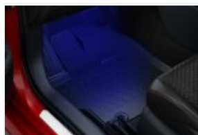
Dywaniki gumowe (PW210-0D033)

Polecane akcesoria niewliczone do powyższej kalkulacji