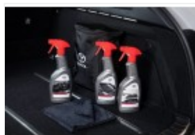
Zestaw kosmetyków samochodowych Toyota (PZWIG-OKIT1-00)