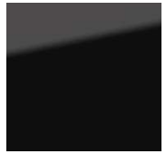
KOLOR LAKIERU: Black Mica (209)