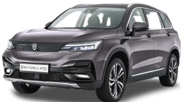
STARRY SKY GREY