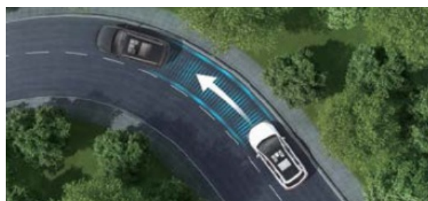
ARS - System kontroli trakcji