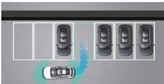
HDC - układ kontroli prędkości zjazdu ze wzniesienia