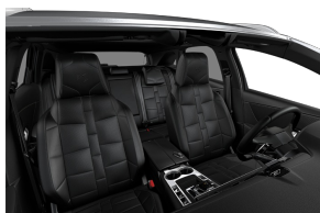
OPÉRA Basalt Black z VAT